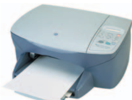
принтер/сканер/копир hp psc 2110